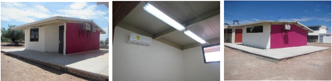
Plantel: Usaer No. 269

Se realizó la construcción de un aula tipo "T" y obra exterior, en Secundaria Estatal Número 19, Usaer 269, de la localidad y municipio de Santa Ana, Sonora, con una inversión de 1.33 millones de pesos, beneficiando a 28 alumnos.