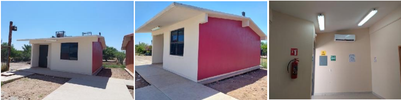
Telesecundaria 130, Usaer 5281

Se realizó la construcción de un aula tipo "T" y obra exterior, en el Plantel de la Telesecundaria 130, Usaer 5281, de la localidad Buaysiacobe y municipio de Etchojoa, Sonora., con una inversión de 1.28 millones de pesos, beneficiando a 40 alumnos.