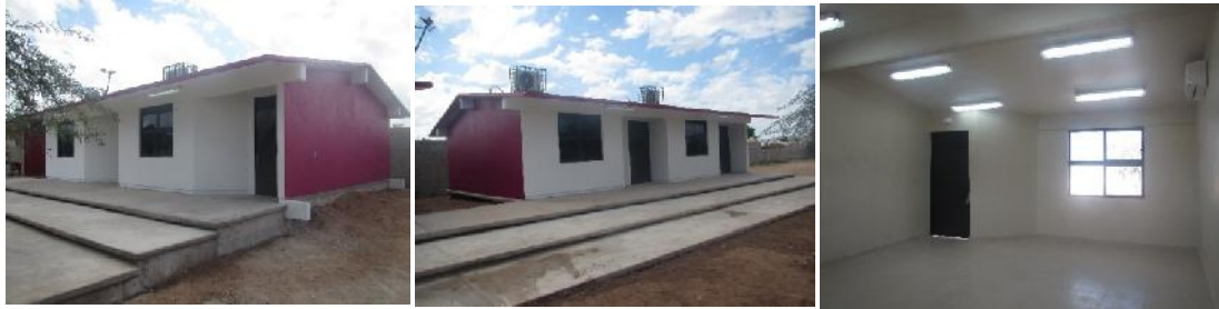
E.P. Nueva creación Puerta Real

Se construyeron dos aulas y obra exterior, en Escuela Primaria Nueva Creación Puerta Real, localidad y municipio de Hermosillo, Sonora, con una inversión de 1.80 millones de pesos, beneficiando a un total de 160 alumnos.