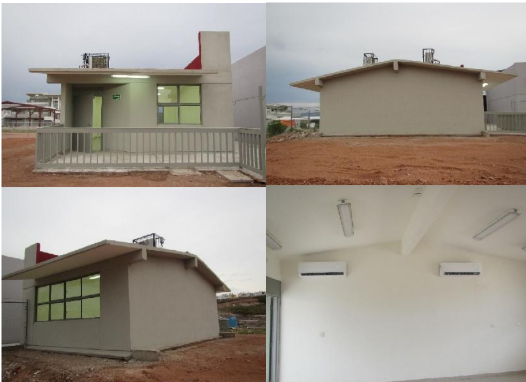
J.N. NC Puerta de Anza

Con una inversión de 1.25 millones de pesos, se construyó un aula y obra exterior, en Jardín de Niños Nueva Creación Puerta de Anza, en la localidad de Heroica Nogales y municipio de Nogales, Sonora, con lo cual se benefició a 30 alumnos.