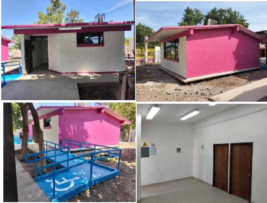
Jardín de Niños Juan de la Barrera Usaer No. 59

Se construyó un aula tipo "T" y obra exterior en el Plantel del Jardín de Niños Juan de la Barrera, Usaer 59, en la localidad y municipio de Navojoa, Sonora, con una inversión de 1.32 millones de pesos, beneficiando a 30 alumnos.