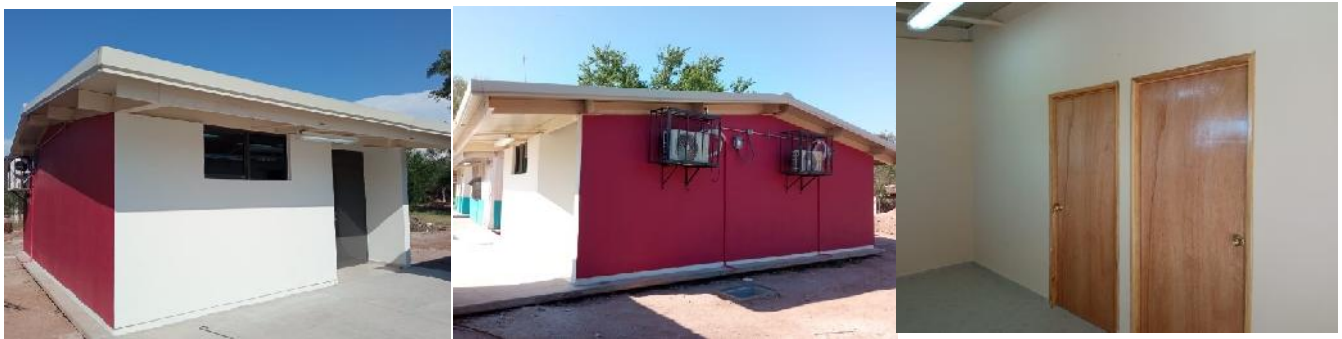
Escuela Primaria Licenciado Miguel Alemán, Usaer 63

En Escuela Primaria Licenciado Miguel Alemán, Usaer 63, de la localidad de Mochibampo y municipio de Huatabampo, sonora, se construyó aula tipo "t" y obra exterior con una inversión de 1.29 millones de pesos beneficiando a 30 alumnos.