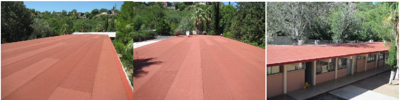
ESC. SEC. 7 de noviembre

Con una inversión de 3.57 millones de pesos, se rehabilitaron aulas y obra exterior, en Escuela Secundaria 7 de Noviembre, de la localidad y municipio de Nacozari de García, Sonora., con lo cual se benefició a 522 alumnos.