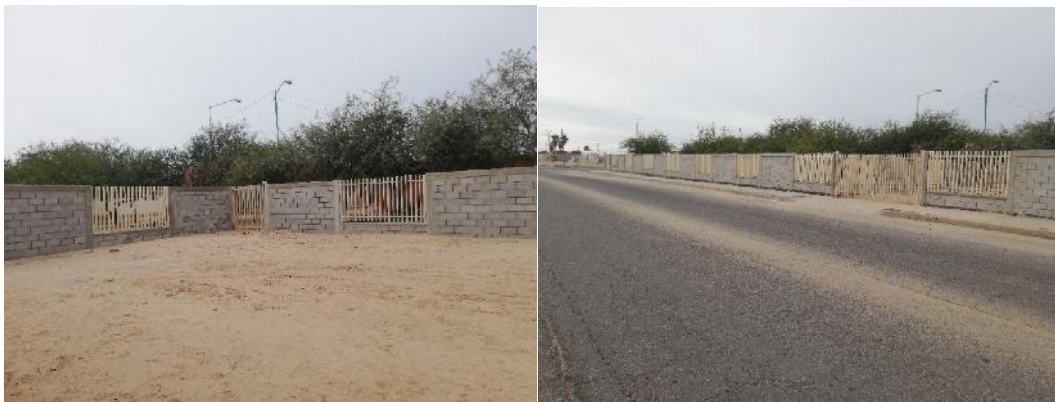
Escuela Secundaria General Número 4

Se construyó barda perimetral, en Escuela Secundaria General Número 4, de la localidad y municipio de San Luis Rio Colorado, Sonora., con una inversión de 2.93 millones de pesos, beneficiando a 784 alumnos.