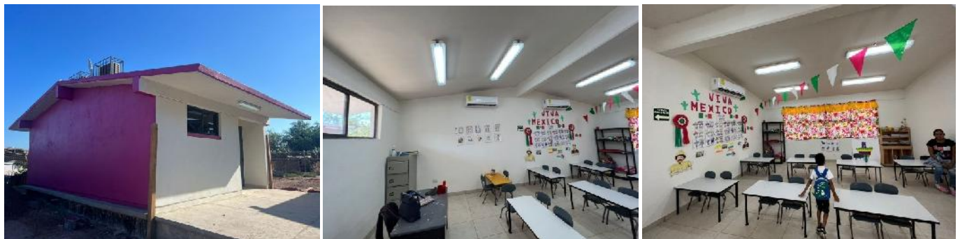
Plantel: J.N. El Lobito

En el Jardín de Niños El Lobito en San Ignacio Río Muerto, Sonora, se construyó un aula y obra exterior con una inversión de 1.37 millones de pesos beneficiando a 30 alumnos.