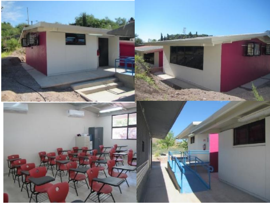
Plantel: E.P. Héroes de Nacozari Ford 129 No. 1

Con una inversión de 1.34 millones de pesos, se construyó un aula y obra exterior en Escuela Primaria Héroes de Nacozari Ford 129 numero 1, de la localidad y municipio de Nacozari de García, sonora, con lo cual se benefició a 30 alumnos.