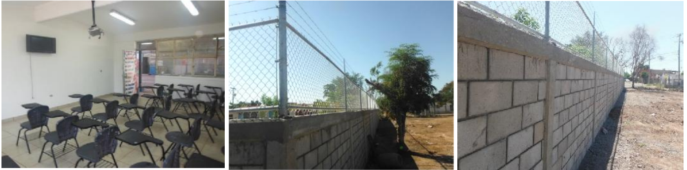
Escuela Primaria Antonio Martínez de Castro

Se realizó la rehabilitación de aulas y barda, en Escuela Primaria Antonio Martínez de Castro, de la localidad de Esperanza y municipio de Cajeme, Sonora., con una inversión de 1.69 millones de pesos, beneficiando a 214 alumnos.