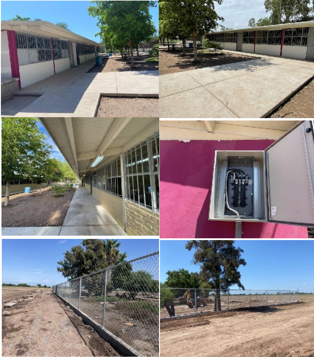
Secundaria Técnica Número 50

Se rehabilitó aulas y obra exterior en Secundaria Técnica Número 50, de la localidad de loma de Etchoropo y municipio de Huatabampo, Sonora, con una inversión de 6.02 millones de pesos, beneficiando a 296 alumnos.