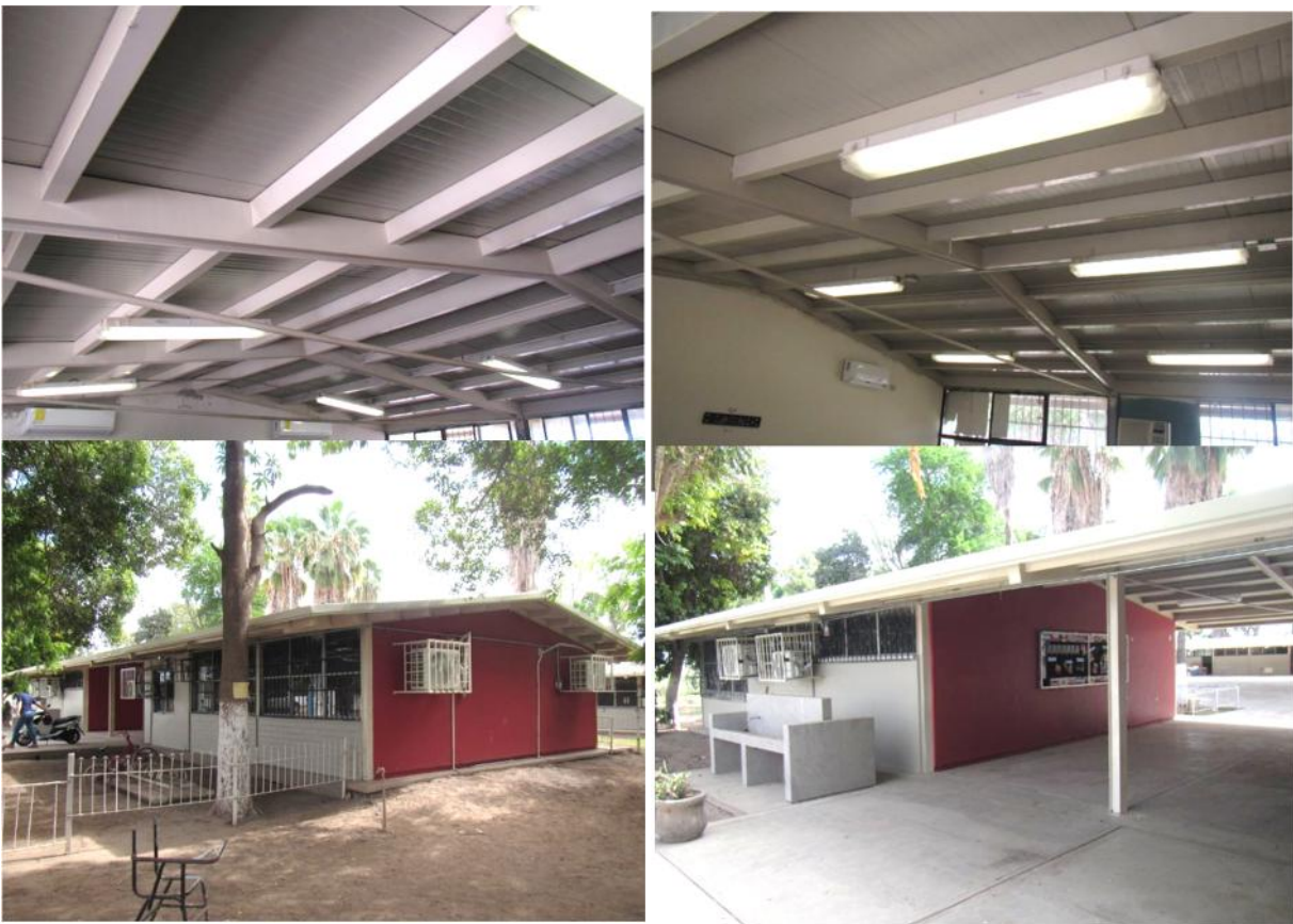
ESC. SEC. Técnica Núm. 31

Se sustituyó techos en oficinas administrativas, biblioteca, laboratorio de ciencias y anexo, en la escuela Secundaria Técnica Número 31, de la localidad y municipio de San Ignacio Rio Muerto, Sonora, con una inversión de 4.20 millones de pesos, beneficiando a 150 alumnos.