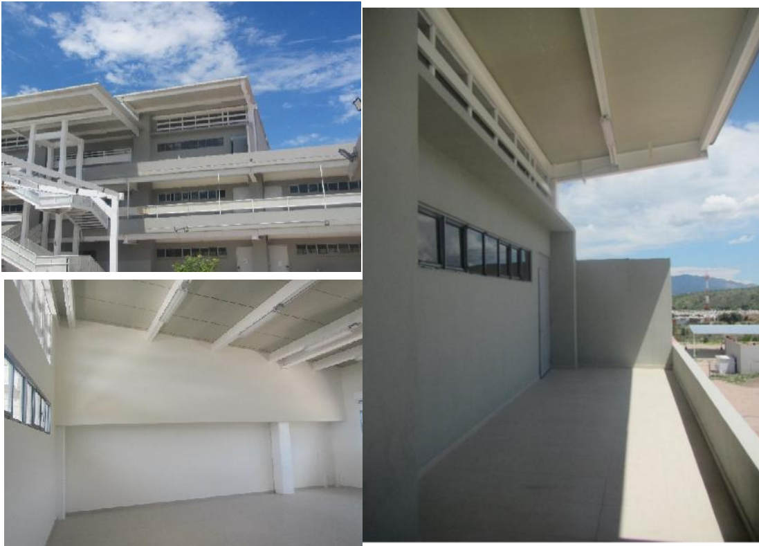
Escuela Secundaria General 5, Jorge Humberto González Godoy

Con una inversión de 2.11 millones de pesos, se construyó un aula y obra exterior, en Escuela Secundaria General 5, Jorge Humberto González Godoy, en la localidad de Heroica Nogales y municipio de Nogales, Sonora, con lo cual se benefició a 40 alumnos.